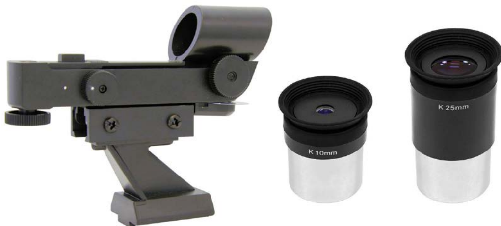
↑ Gli accessori di serie: un cercatore red dot e una coppia di oculari Kellner da 10 e 25 mm. ← Vista d'insieme e alcuni particolari della montatura Push+ .

Ricordiamo che l'ottica arriva già provvista di anelli e slitta standard GP