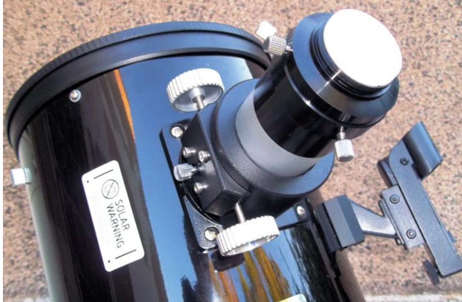
↑ Il foccheggiatore da 2" è robusto e si è dimostrato preciso e fluido.