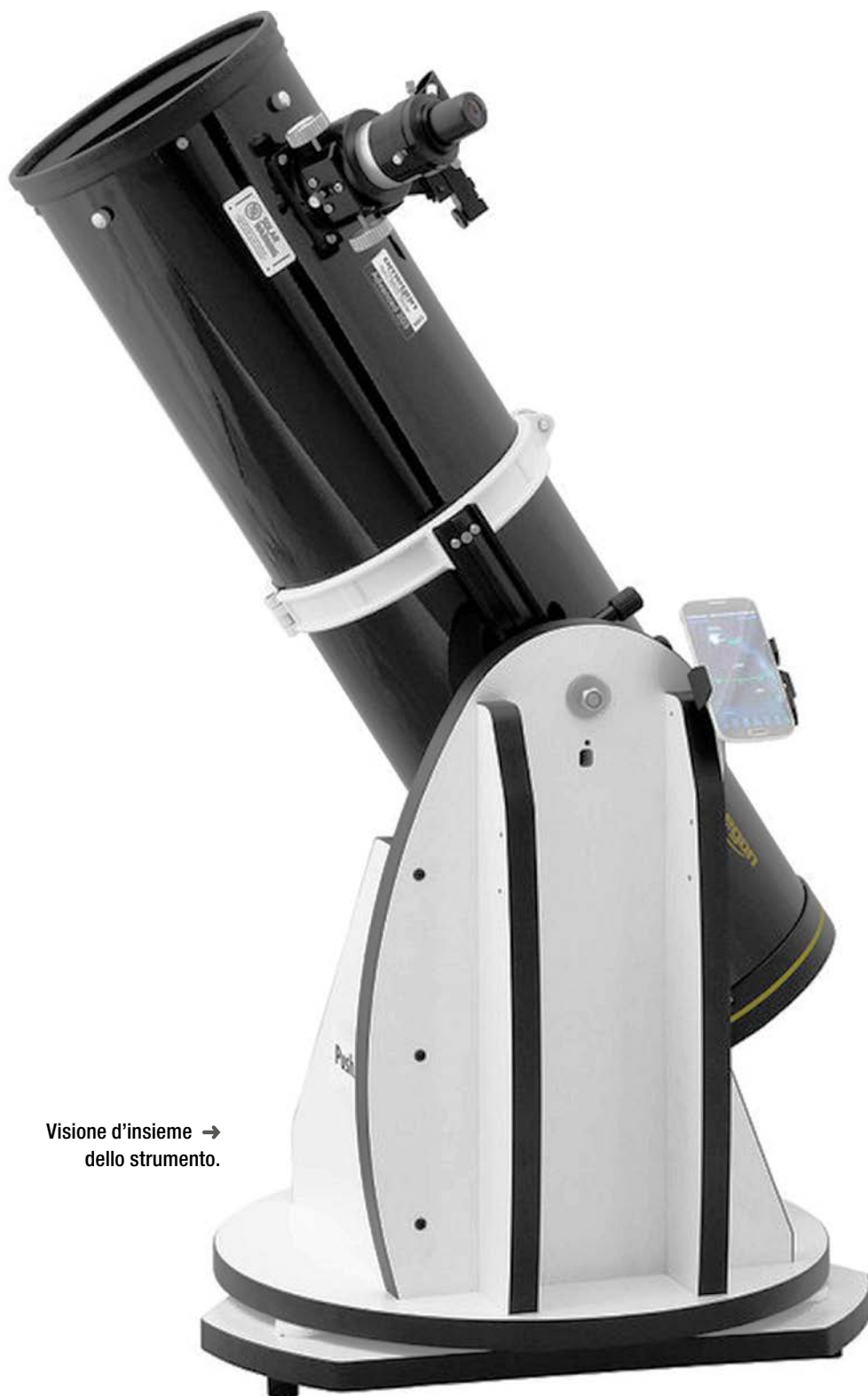
Visione d'insieme → dello strumento.

I telescopi Dobson, anche nelle configurazioni più elaborate con puntamento assistito o automatico, sono strumenti pensati per offrire un grande diametro unito alla trasportabilità; ma oltre all'impiego per osservazioni visuali non concedono molto di più.