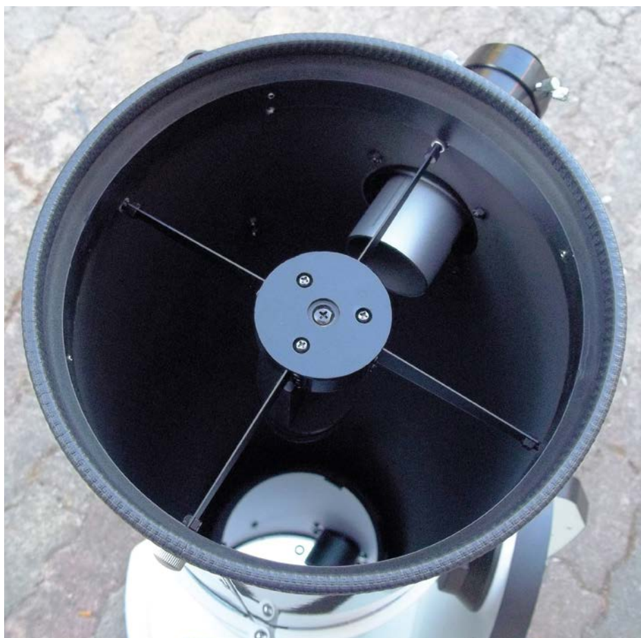
↑ Vista dall'alto del tubo ottico: si può apprezzare la buona opacizzazione interna. Il focheggiatore intercetta un po' il fascio luce in entrata e contribuisce ad accrescere l'ostruzione operata dal secondario.

Il focheggiatore ricevuto in prova è il Crayford 2" Omegon (prezzo di listino 69 €). Questo focheggiatore da 2" deve essere inserito e serrato nella flangia presente sul tubo mediante due minuscole brugole. Tale operazione è piuttosto semplice, poiché si innesta a pressione senza alcun lasco. Il focheggiatore può accogliere oculari e accessori da 2" e da 1,25" mediante riduttore. Per entrambe le misure di barilotto, il focheggiatore propone un sistema ➔